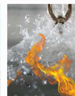
سیستم اعلان و اطفا حریق