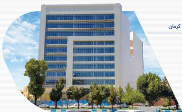
پاقت ملل تجاری، اداری - کرمان