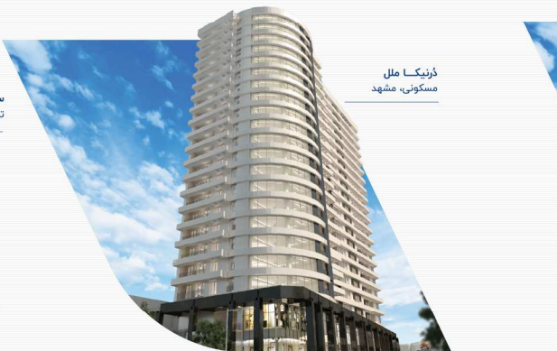
دزنیگا ملل مسکونی، مشهد