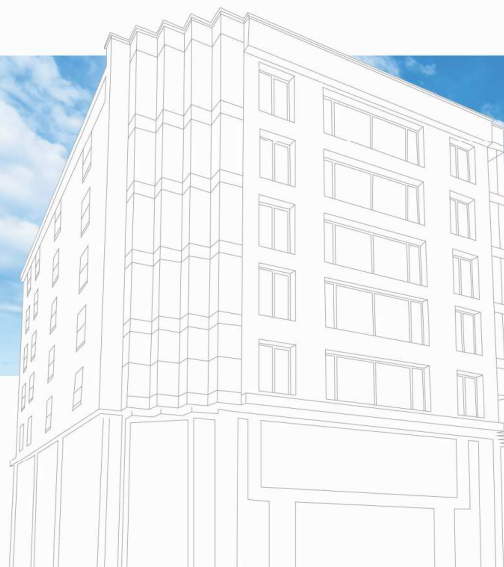
به نام یگانه معمار هستی In The Name Of God