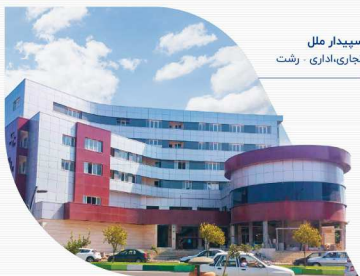
سپیدار ملل تجاری، اداری - رشت