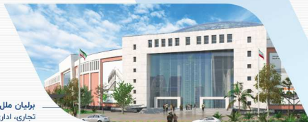
برلیان ملل تجاری، اداری و خدماتی