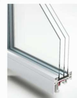
استفاده از مصالح مرغوب