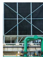
سیستم سرمایش و گرمایش تلفیق هوشمندی سردی و گازی سرد تلفیق هواسازهای مرکزی و منطقه‌ای